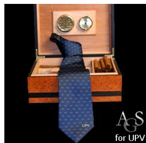
Universidad Politecnica Valencia, Spanien