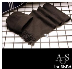
BMW München, Deutschland