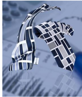
Bank Azerbaijan, Moskau, Russland