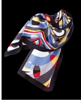
OASIS Exclusive, Russland