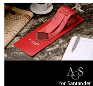
Santander Bank, Spanien