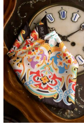
RFT, Real Fabrica de Tapizes Spanien