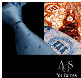
Torres Weine/Sherry Spanien