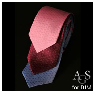
DIM Paris, Frankreich