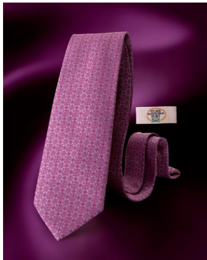
Hotelfachschule Sevilla, Spanien