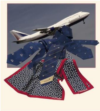
Transaero, Moskau, Russland