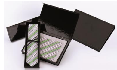
Vossloh AG, Werdohl, Deutschland