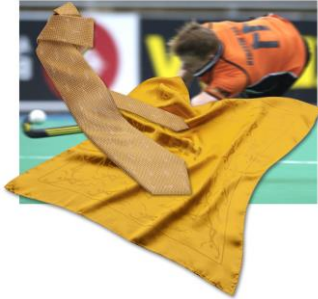
Federation International Hockey, Lausanne, Schweiz