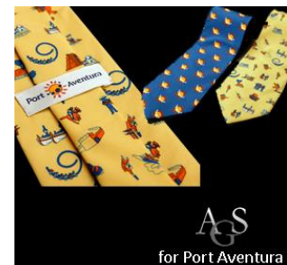
Port Aventura Tarragona, Spanien